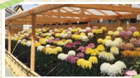
大菊十二鉢花壇の部